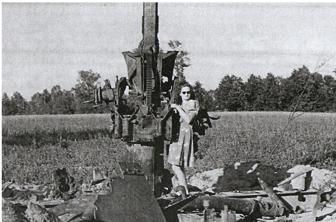
Zničený 88 mm protiletadlový kanón FlaK 37 včetně munice.

Následně došlo ke střetu předsunutých sovětských jednotek 4. Ukrajinského frontu generála Jeremenka s krycími nacistickými oddíly. Wehrmacht měl v Petřvaldě a jeho blízkém okolí rozmístěnu posádku protiletadlového dělostřelectva s FlaK 88 využívanými ke konci války i k likvidaci tanků. Na rozdíl od osádek z okolních obcí měla ta petřvaldská dostatek munice, které se již jinde nedostávalo. Dále se zde nacházely zbytky oddílů ustupujících od Ostravy.