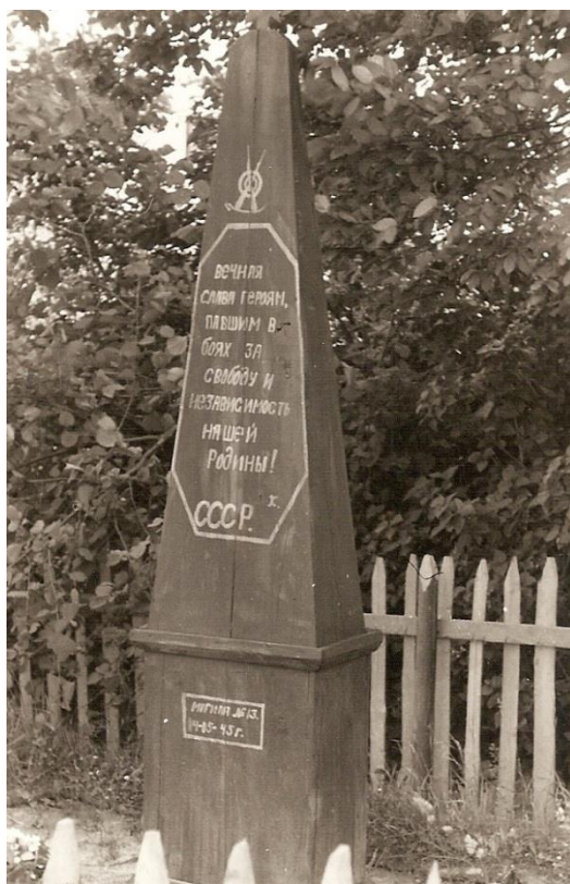
Společný hrob Rudoarmějců v Dostálově zahradě s nápisem: Věčná sláva hrdinům padlým za svobodu a nezávislost naší vlasti!

V bojích o Petřvald zahynulo 33 rudoarmějců (z toho dva důstojníci), čtyři byli zranění, pět civilních obyvatel (z toho jedno dítě), tři byli ranění. Těla vojáků byla pohřbená v několika zahradách místních občanů, posléze exhumována a převezená na hřbitov do Frýdku.