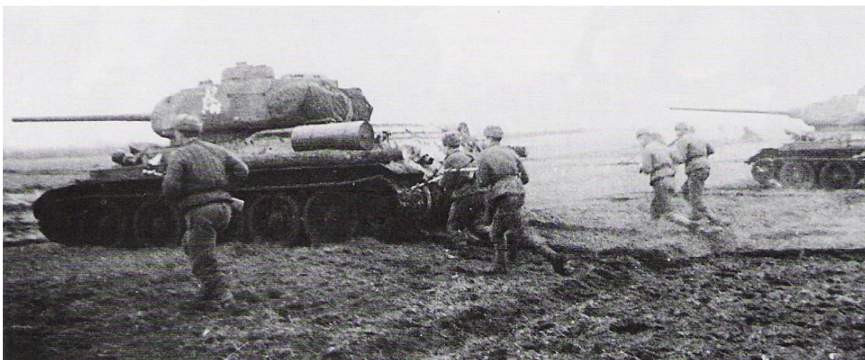
Tanky T34/85 a samopalníci v prošívaných vatovaných kabátech. V případě deštivého počasí byly doplněny o celtové pláště.

Tomuto náporu již oddíly německé armády neodolaly. Zapálily školu a stodoly aby zpomalily postup rudoarmějců a mohly v hustém kouři ustoupit z vesnice. Zpřetrhaly elektrické a telefonní vedení, náložemi vyhodily betonový most přes řeku Lubinu, jehož zničením se snažily zabránit přesunutí posil od Petřvaldíku, který byl osvobozen již 2. května. Při detonaci byla tlakovou vlnou a úlomky vytlučena okna domů v blízkém okolí. Výbuch most nezničil docela, došlo jen k jeho rozlomení. Pěšími byl i nadále užíván, povozy a těžká technika využívala brodu, který je vedle nového mostu (postaveného na stejném místě) patrný dodnes.