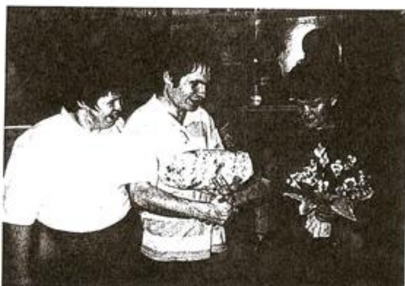
Oslava narozenin v ÚSP

Berte, prosím, toto upozornění jako pohled vedení ÚSP na problematiku handicapovaných lidí.